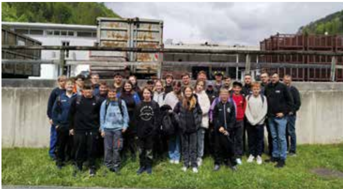
3c der MS Voitsberg bei Krenhof