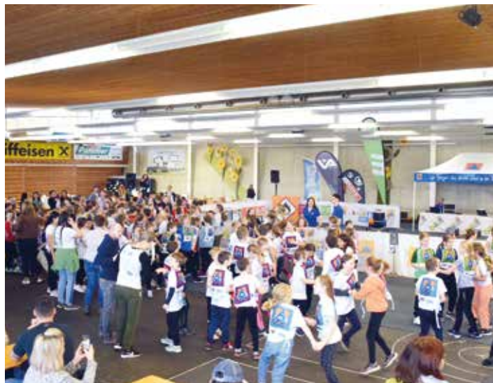
Spannendes Finale in der Kirschenhalle Hitzendorf

Steiermarkweit nahmen an der Safety Tour 232 Klassen mit 4.600 SchülerInnen an 18 Veranstaltungen teil. Das Landes-