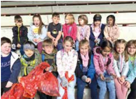
Volksschule Voitsberg, Klasse 1b