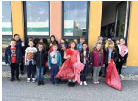
Volksschule Voitsberg, Klasse 1a