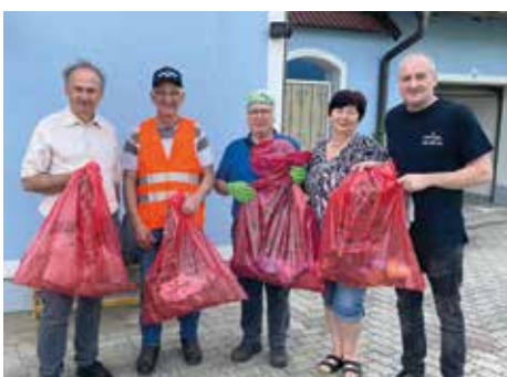
ESV Gut Eis Voitsberg