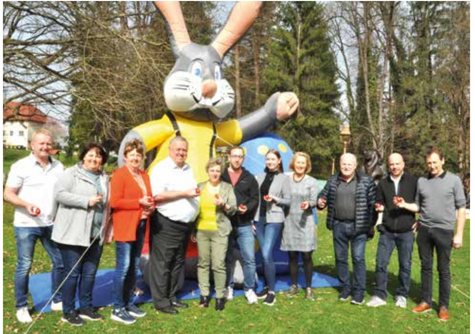
FunktionärInnen der SPÖ Voitsberg und der Kinderfreunde Voitsberg organisierten die Ostereiersuche im Schlosspark Greißenegg

Herzlicher Dank an die Stadt- und Gemeinderäte sowie Mitglieder der Kinderfreunde für die Organisation.