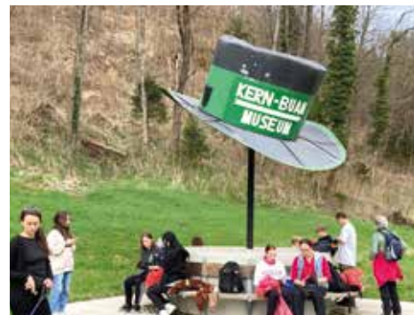
Firmgruppe der Pfarre beim Frühjahrsputz