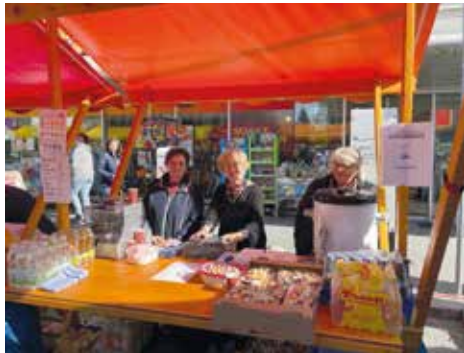
Gute Stimmung am Ostermarkt Voitsberg

Schnappschüsse von zahlreichen Veranstaltungen