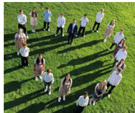
Gewinner: dritter Mottomittwoch, 4a-Klasse

Der Motto-Mittwoch wurde als „Glücksmoment“ konzipiert: Die gesamte Schule sollte an jedem Mittwoch im Mai zeigen, wie wichtig Zusammenhalt und das „Wir-Gefühl“ an der Mittelschule Voitsberg sind. Deshalb wurden Vorschläge für die Motto-Tage in Form eines einheitlichen Kleidungsthemas mit den Klassen abgesprochen und die Wünsche der Jugendlichen berücksichtigt: „Black and White“, „Es lebe der Sport“, „Elegant und chic“ sowie