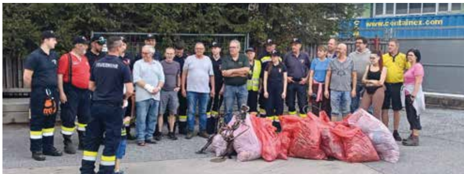
Frühjahrsputz: FF Krems, der Fassdaubenclub Krems und der Fischereiverein Voitsberg