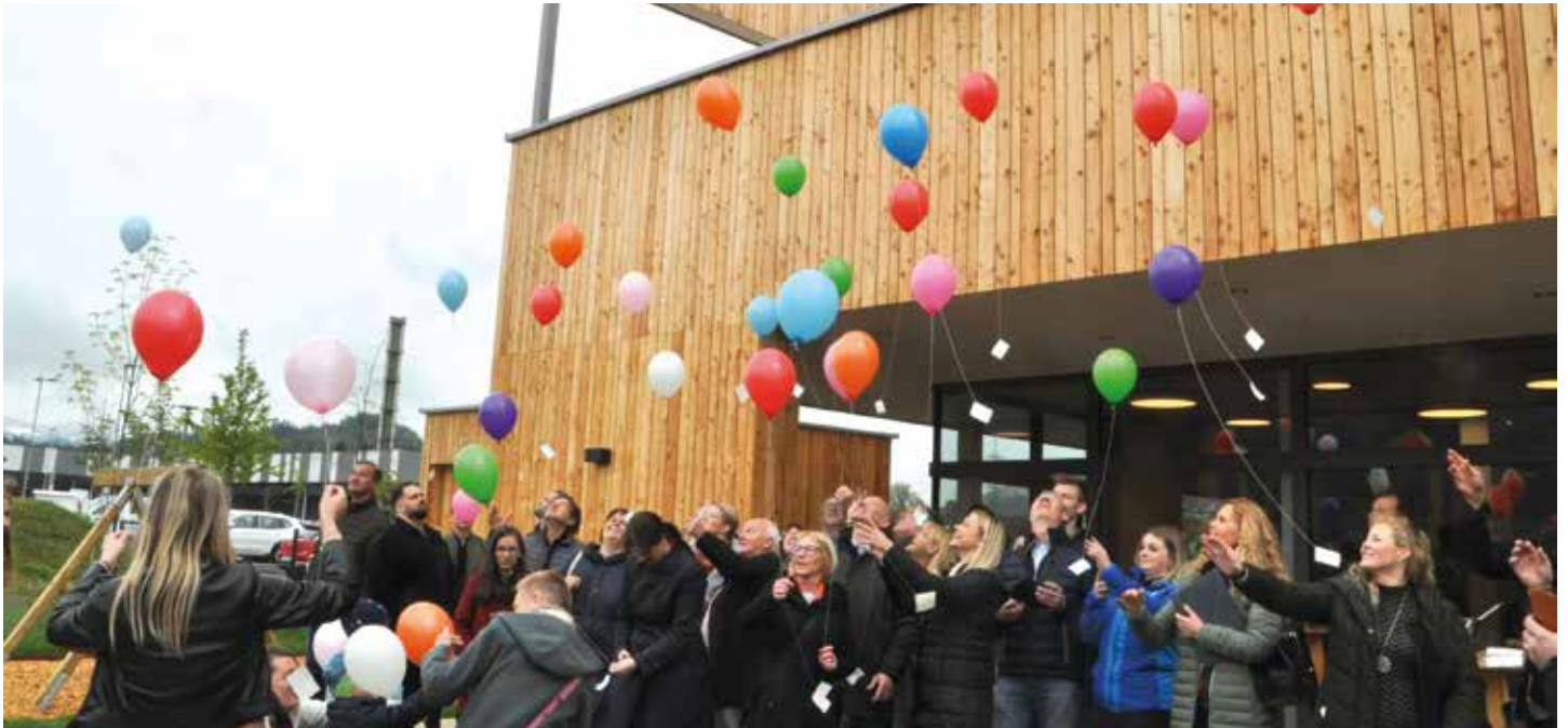
Gute Laune herrschte bei den Eltern und Ehrengästen bei der offiziellen Eröffnung

Erfreulicher Tag für die Voitsberger Kinder und Eltern