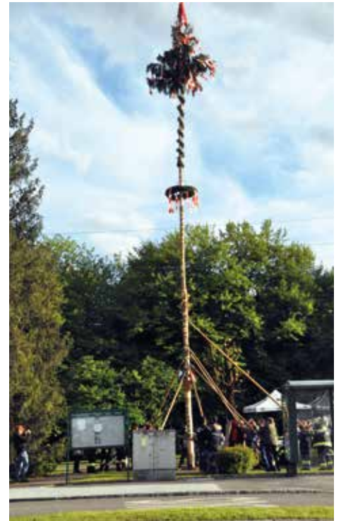
Familie Herzele spendete den Baum