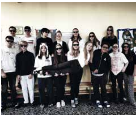
Gewinner: erster Mottomittwoch, 4b Klasse

Die Mittelschule Voitsberg legt als zertifizierte Glücks-Schule großen Wert auf Zufriedenheit, Optimismus und das Wohlbefinden der SchülerInnen.