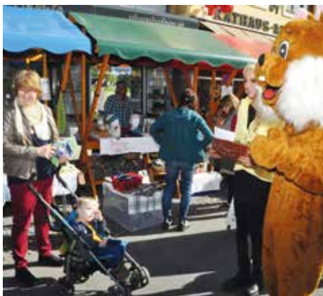
Der Osterhase bei seinem Rundgang

Ob kunstvoll bemalte Ostereier, dekorative Tischgestecke und vieles mehr – für jeden Geschmack war etwas dabei. Musikalisch umrahmt wurde diese Tra-