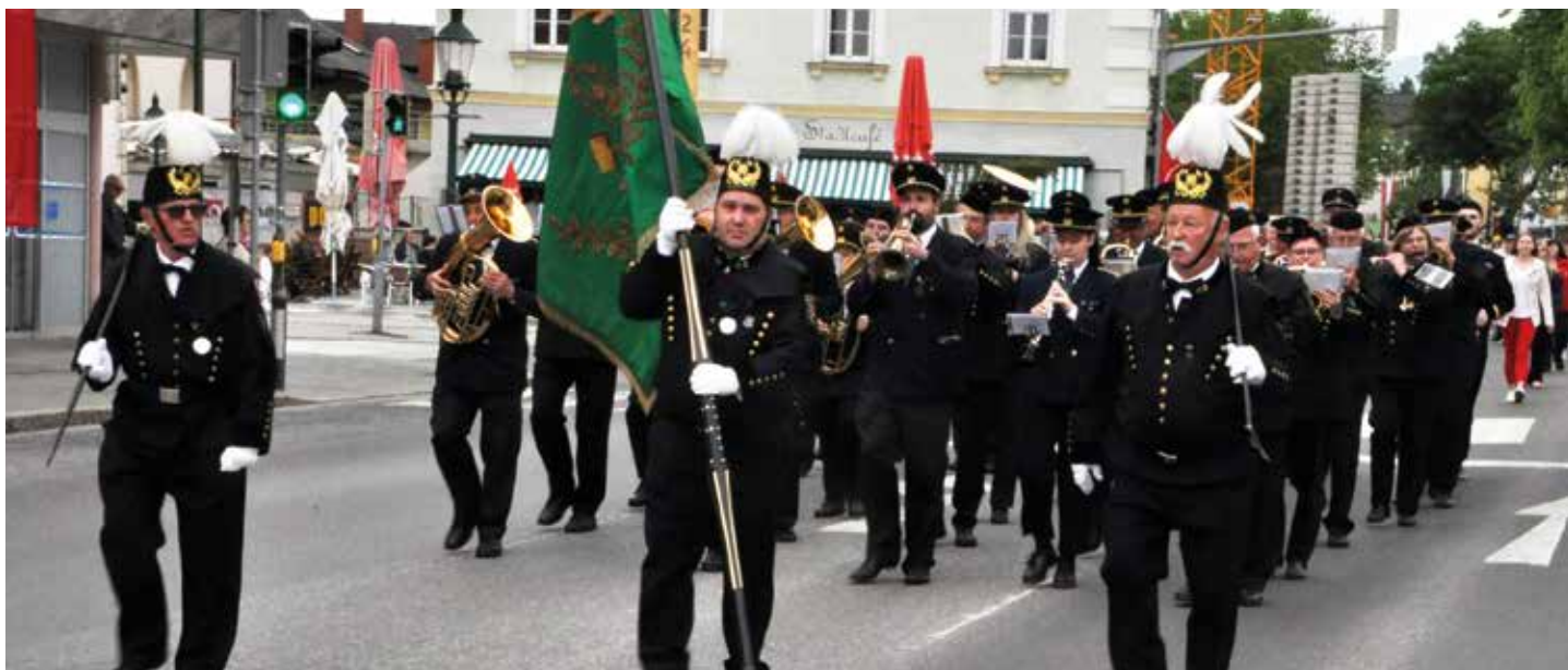
Traditioneller Maiaufmarsch: Angeführt von der Bergkapelle Hödlgrube-Zangtal