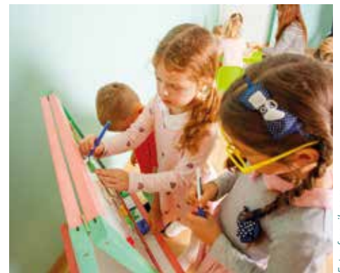
Vertieft ins kreative Gestalten