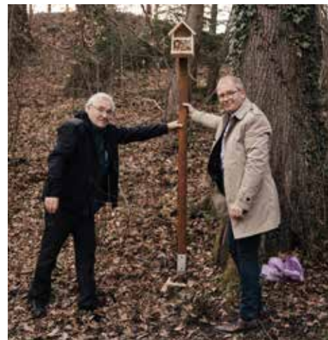
Aufstellen einer Eichhörnchen-Futterstelle