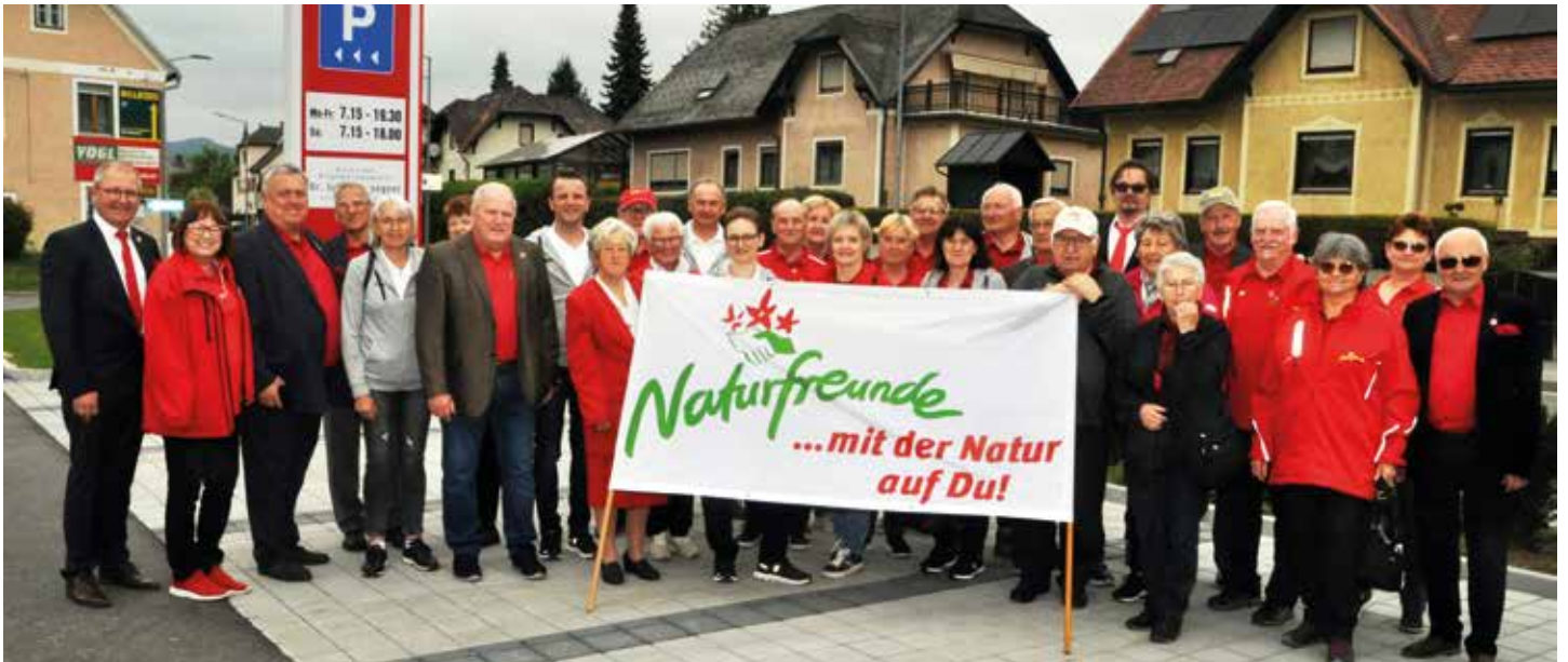
Die beeindruckende Delegation der Naturfreunde Voitsberg mit VertreterInnen des Stadtrates