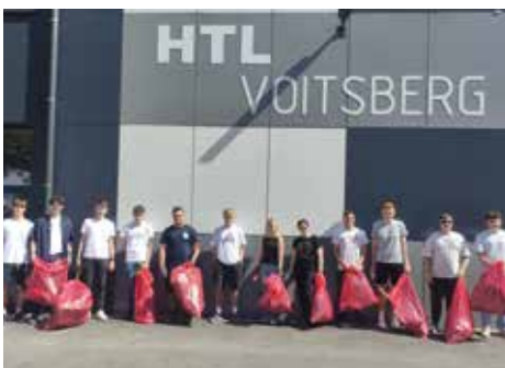
Höhere Technische Bundeslehranstalt