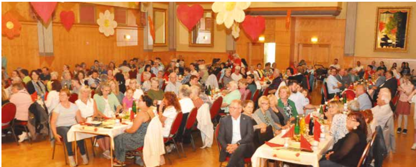
Ausgezeichnet besucht war die Muttertagsfeier der Stadtgemeinde Voitsberg in den Stadtsälen