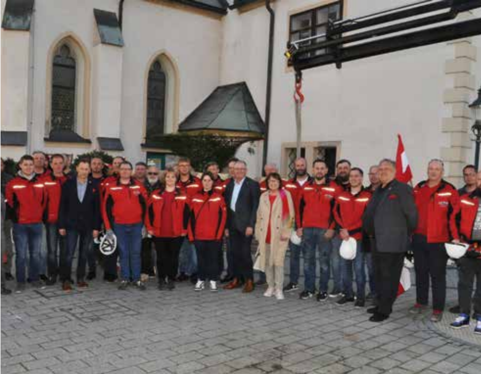
Die Mitarbeiter des Bau- und Wirtschaftshofes und der Stadtwerke mit den Ehrengästen

Der Voitsberger Maibaum wurde am Michaeliplatz aufgestellt