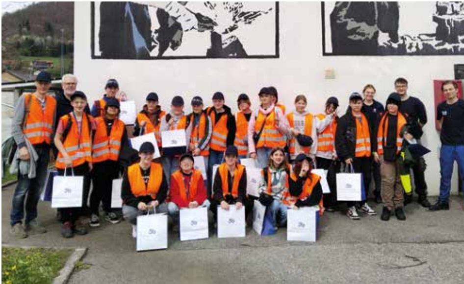
Die 3b-Klasse beim „Berufserlebnistag Technik“ in der Firma Stözlze Oberglas

Grundpfeiler des Lehrplans im Unterrichtsfach „Berufsorientierung“ an der Mittelschule Voitsberg stellen Begegnungen in Unternehmen dar. Das ermöglicht ein Erkunden und Erleben des Arbeitsalltags unterschiedlicher Berufsgruppen.