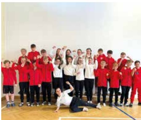
Gewinner: 2. Mottomittwoch, 2a Klasse