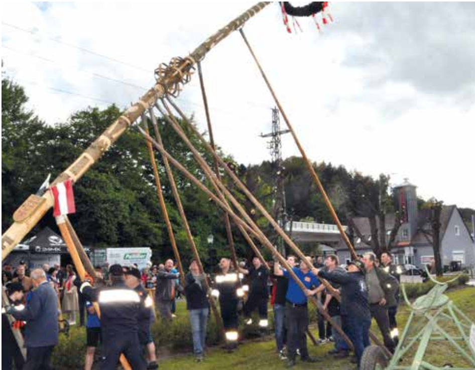
Die FF-Kreams und der Fassdaubenclub Kreams haben den Maibaum am Ortsplatz aufgestellt

Feuerwehr Kreams und Fassdaubenclub Kreams im Einsatz