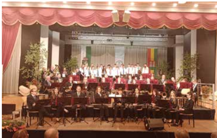
Die Werkskapelle Bauer und der Chor der MMS Stallhofen