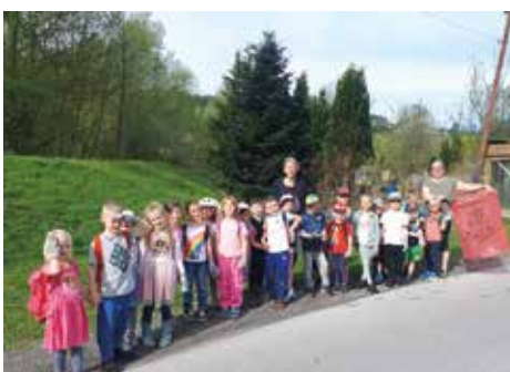
Hopsi Hopper Kindergarten Krems