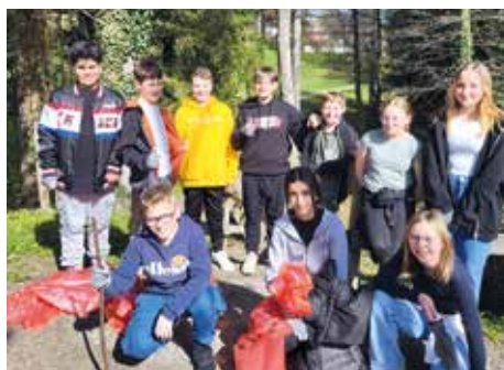
Friedrich Aduatz Mittelschule Voitsberg