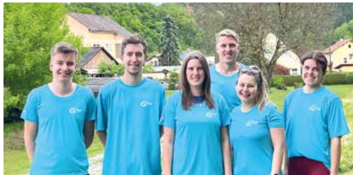
Die TeilnehmerInnen beim Wings for Life Spendenlauf

Voitsberger Landjugend beim Wohltätigkeitslauf World Run Wings for Life.