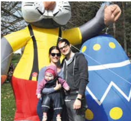
Ein Event für Familien