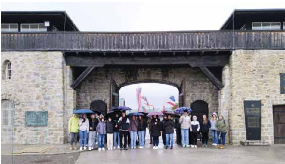
SchülerInnen der 4abc-Klassen der Mittelschule Voitsberg in der Gedenkstätte Mauthausen

Bildungsfahrt ins ehemalige Konzentrationslager Mauthausen