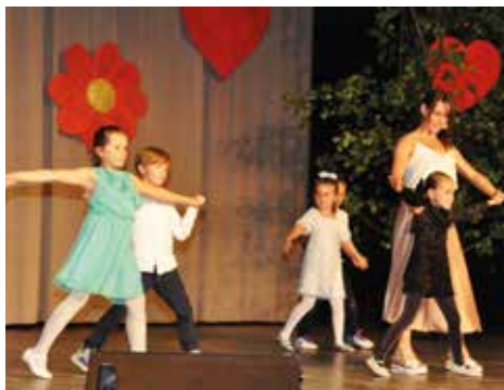
Kindergarten Hopsi Hopper