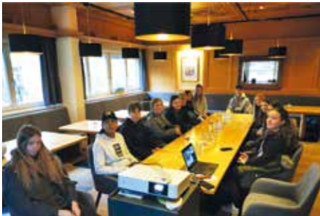
4b der MS Voitsberg im „Stübel“ der Therme Nova