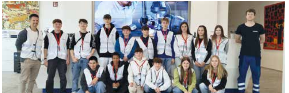
4a der MS Voitsberg bei ZETA in Lieboch