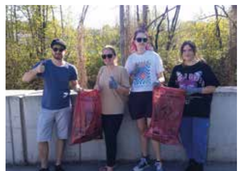
Jugendtreff Timeout Voitsberg