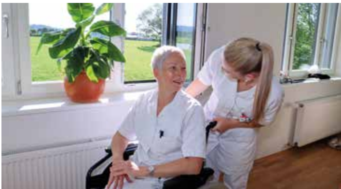
Der Bedarf an Pflegefachkräften steigt ständig

Ausbildungsstandort ist die Fachschule Maria Lankowitz