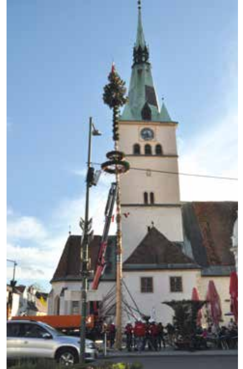
Weithin sichtbarer Maibaum