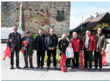
Berg-und Naturwacht Voitsberg