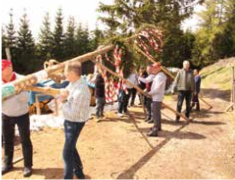
Maibaumaufstellen am Sattelhaus

Schnappschüsse von zahlreichen Veranstaltungen