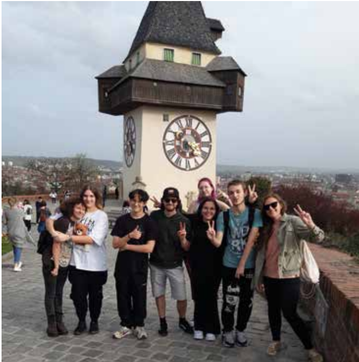
Voitsberger Jugendliche besuchten auch den Grazer Schlossberg

Ausflug mit dem Jugendtreff TimeOut zur Protestausstellung nach Graz