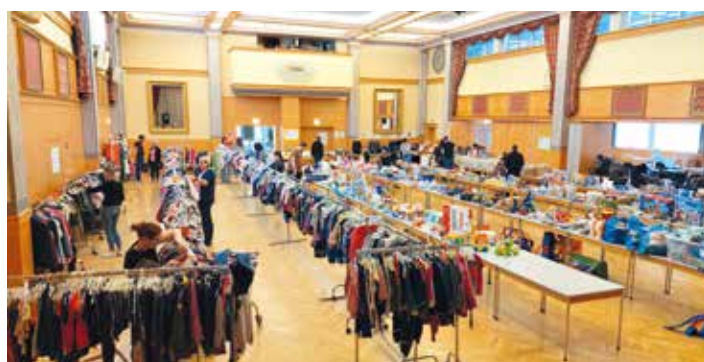
Mehr als 7.000 Artikel wurden zum Verkauf angeboten

Rund 55 ehrenamtliche HelferInnen sorgten drei Tage lang für einen reibungslosen Ablauf. Mehr als 7.000 Artikel rund ums Kind wurden zum Kauf angeboten. Die Waren wurden gegen einen Aufschlag für das EKIZ verkauft.