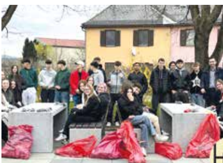
HAK Voitsberg, Klassen 1S+2S+2CB