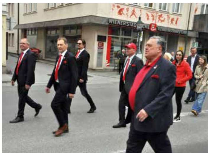
Feierlicher Aufmarsch am Voitsberger Hauptplatz