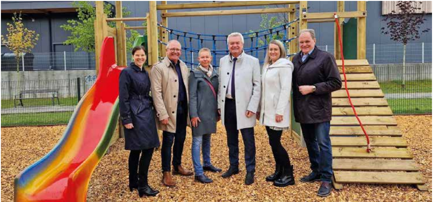
Die Ehrengäste bei der Eröffnung des neuen Kindergartens und der neuen Kinderkrippe

Insgesamt werden 350 Kinder in Voitsberg betreut