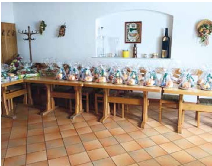
Wertvolle Preise gab es für die TeilnehmerInnen