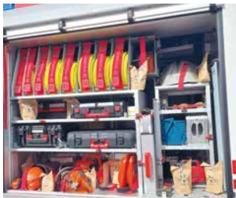
Gut versteckte Geschenke im Rüsthaus

Das Eltern Kind Zentrum Voitsberg hat zusammen mit der Freiwilligen Feuerwehr Kreams im März im Rüsthaus Kreams eine große Osternestsuche veranstaltet.