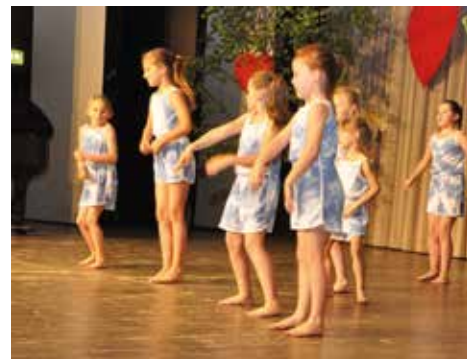
TSC Burghof Voitsberg