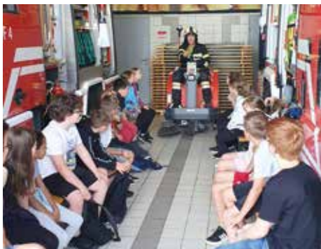
Vorlesetag bei der Feuerwehr Voitsberg