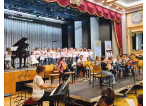
Stadtsäle: Konzert der Musikschule