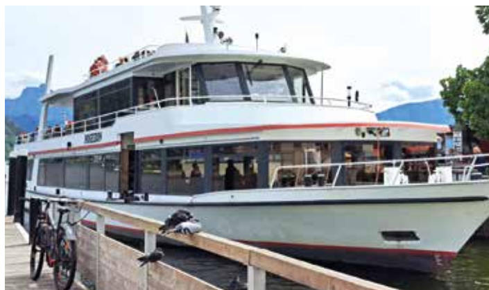
Wunderschöne Seerundfahrt über den Traunsee

Auf dem Programm standen Besichtigungen und eine Seerundfahrt bei schönem Wetter auf dem Traunsee. Insgesamt waren 53 TeilnehmerInnen an diesem interessanten Ausflug mit Begeisterung dabei.