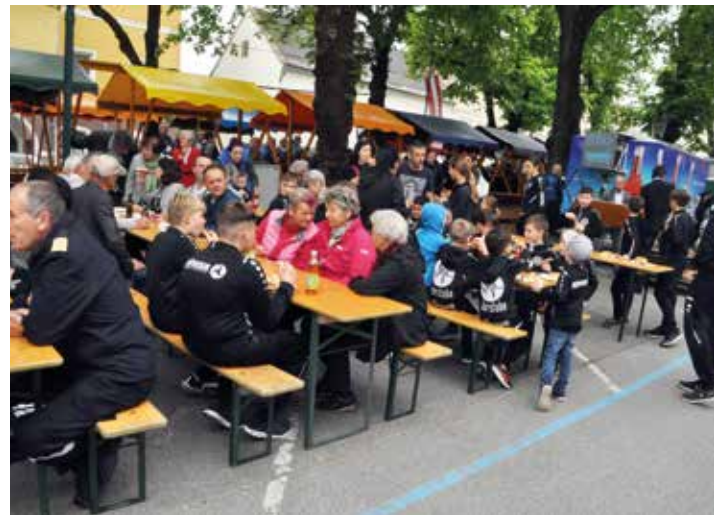
Die TeilnehmerInnen stärkten sich am Voitsberger Hauptplatz