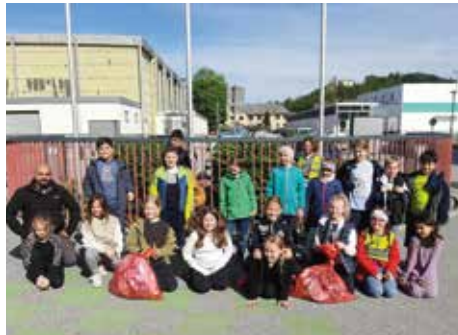
Volksschule Voitsberg, Klasse 2c