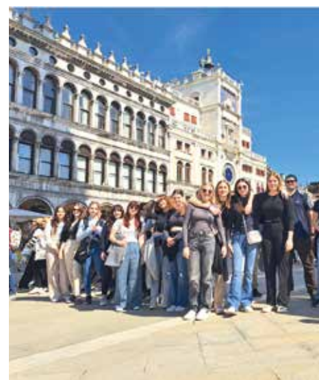
Ausflug nach Venedig

Anschließend entwarfen sie gemeinsam eine Website für beide Schulen, auf der sie die eigene Schule und den Ort, in dem sie leben präsentierten. Sie sangen sich gegenseitig österreichische und italienische Lieder vor, wobei der Höhepunkt das gemeinsame Singen mit dem Inklusions-Chor