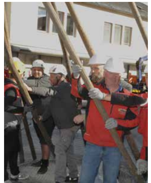
Viele fleißige Hände vollendeten das Werk

Am Michaeliplatz in Voitsberg wurde der Maibaum der Stadtgemeinde Voitsberg bei frühlingshaftem Wetter aufgestellt.