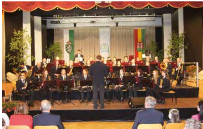
Die Werkskapelle Bauer in voller Besetzung