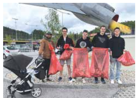
Styrian Hurricanes Voitsberg