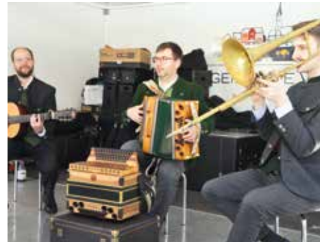
Ostermarkt: Trio der Musikschule Voitsberg