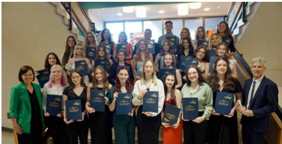
29 HLW-MaturantInnen: Neun mit ausgezeichnetem Erfolg und sechs mit gutem Erfolg