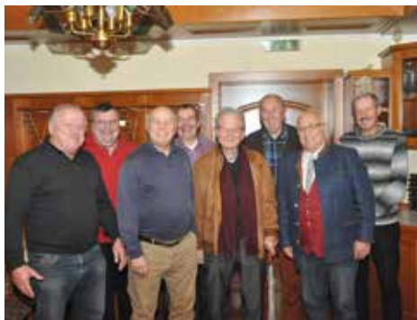
Legendärer Voitsberger Stammtisch 2016